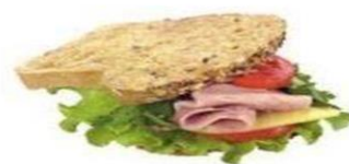
Тост с ветчиной