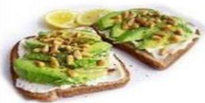
Тост с авокадо