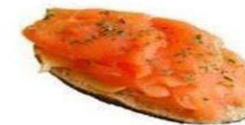
Тост с рыбой